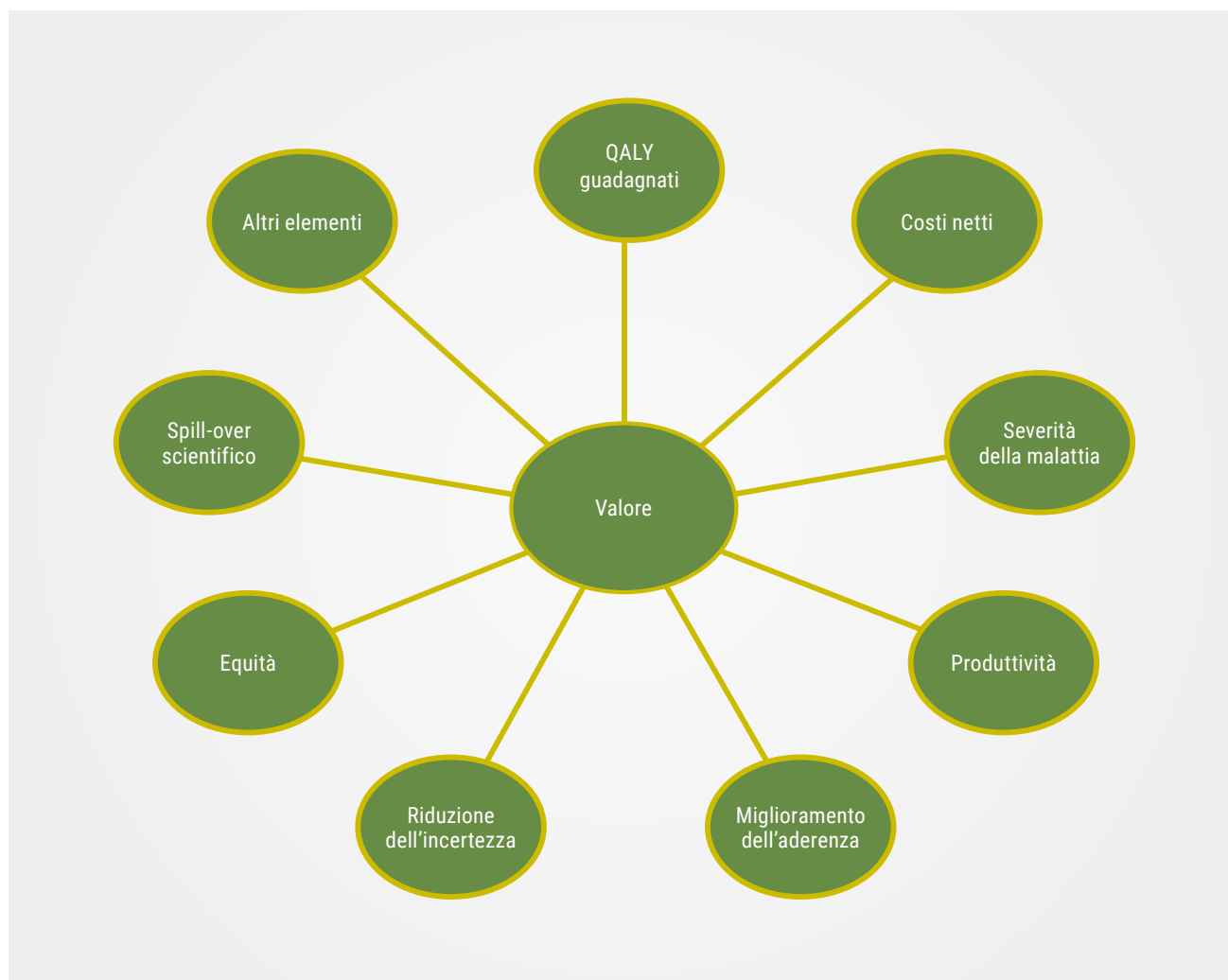
Figura 1: Dimensioni del valore secondo AIFA (AIFA, 2020)

Alla multidimensionalità intrinseca del concetto di valore terapeutico, si aggiungono poi le difficoltà derivanti dalla produzione di solide evidenze sperimentali. Come anticipato, spesso le TA sono rivolte a malattie rare o ultra-rare; in futuro, però, è atteso l'arrivo anche di TA per malattie non rare, con una più numerosa popolazione target (Ronco et al. , 2021). Anche in questo caso sarebbero comunque destinate a sottogruppi di pazienti molto selezionati (per esempio: stratificazione dei pazienti in base a specifiche mutazioni genetiche), replicando di fatto le condizioni date dallo sviluppo di un medicinale per una malattia rara.